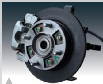
2. 4륜 유압식 디스크 브레이크 채용