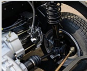
7. 맥퍼슨 타입의 서스펜션 채용