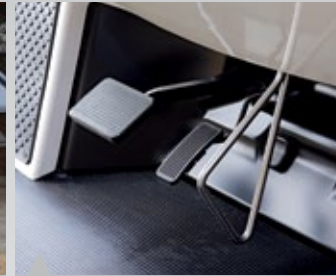
10. 미끄럼 방지 및 악셀레이터 오작동 방지 Bar