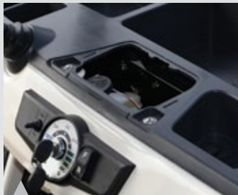
6. 점검 편의성을 극대화한 점검구