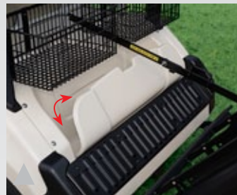
13. 다목적 후면 사물함