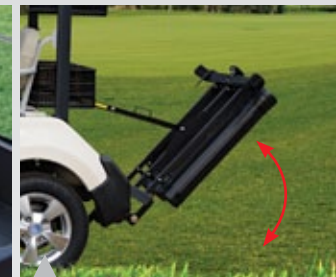
15. 낮은 각도의 백스텐드