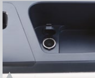
4. 차량용 12V 충전잭