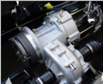
1. 동급최대출력모터 장착(AC/4.6kw)

Technology | APRO의 기술력과 첨단 과학으로 휴머니즘을 실천합니다.