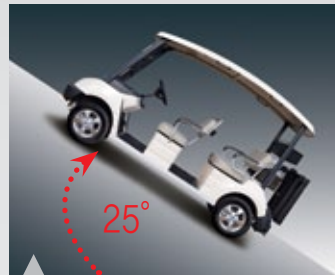
8. 동급 최강의 오르막 등판능력