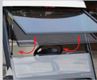
9. 2분할방식 하부 개폐식 원도우실드

Specificity | APRO의 다양한 편리성은 특별함과 즐거움을 선사합니다.