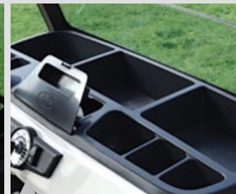
14. 전면부 다양한 수납공간