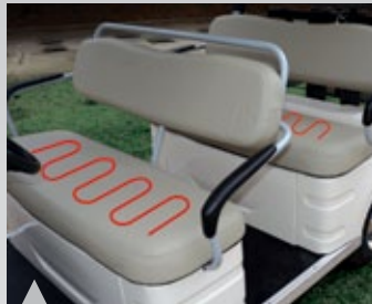
3. 앞/뒤 좌석 열선시트 채용