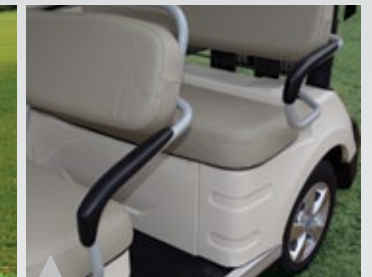
16. 운전자를 배려한 낮은각도의 팔걸이